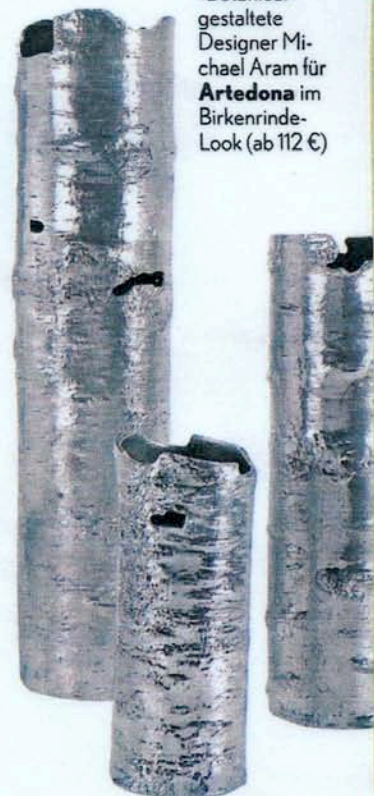
Rindenwahn: Die Alu-Vasen »Botanical« gestaltete Designer Michael Aram für Artedona im Birkenrinde-Look (ab 112 €)