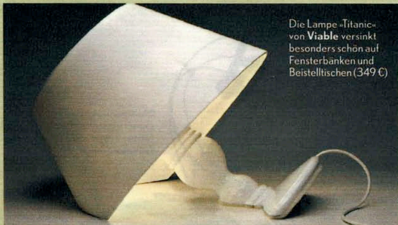
Die Lampe »Titanic« von Viabé versinkt besonders schön auf Fensterbänken und Beistelltischen (349 €)