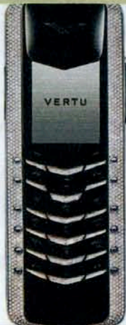
Brillant: Das Weißgold-Handy »Full Pavé Diamond« von Vertu ist ganz bescheiden mit 943 Diamanten besetzt (55.000 €)