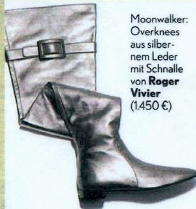
Moonwalker: Overknees aus silbernem Leder mit Schnalle von Roger Vivier (1.450 €)