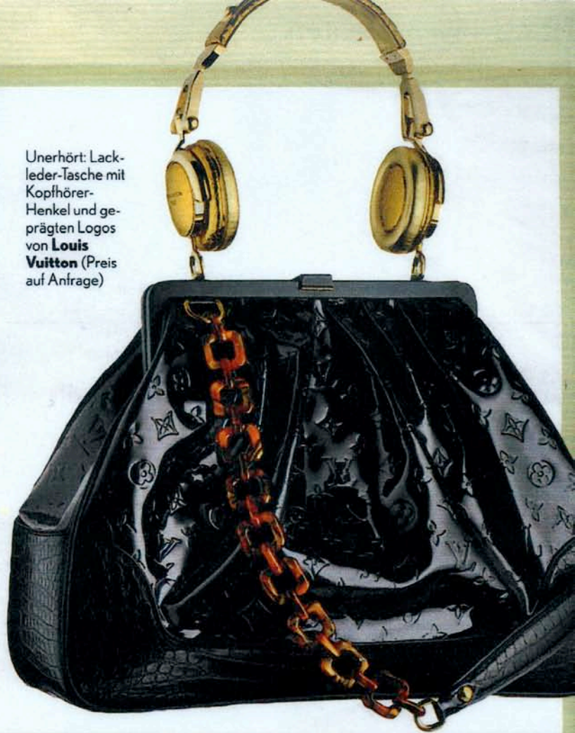
Unerhört: Lackleder-Tasche mit Kopfhörer-Henkel und geprägten Logos von Louis Vuitton (Preis auf Anfrage)