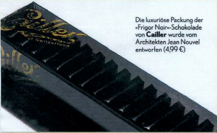
Die luxuriöse Packung der »Frigor Noir«-Schokolade von Cailler wurde vom Architekten Jean Nouvel entworfen (4,99 €)