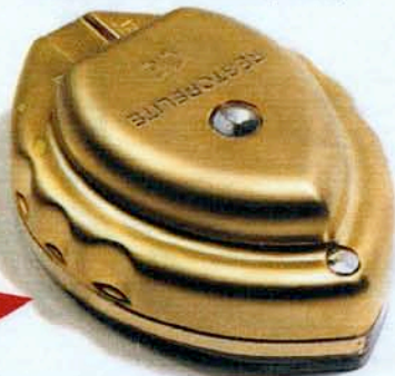
OP überflüssig: Das Gerät von Restorelite glättet Falten und feine Linien mit Hilfe von Licht (354 €)